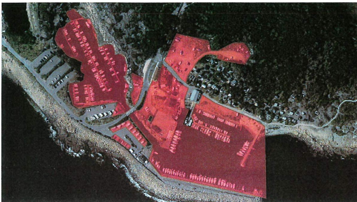
Bilaga 1 – kartbilaga del av fastigheterna Halmstad Eketånga 4:3 och Halmstad Eketånga 8:1